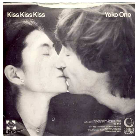
Type 2: glanzende hoes met grote uitsparing