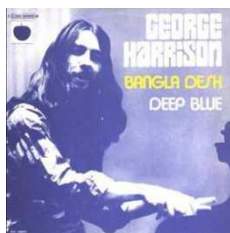
Franse blauwe hoes.

Weinig verzorgde groen-bruine Belgische hoes met een onduidelijke foto van George van eind 1970 aan de piano. In het midden is er een roze vlekje gedrukt. Rechtsboven staat het weinig contrastrijke Belgische serienummer. De titel is er ook erg onduidelijk opgeschreven. Rechts onderaan staat een Apple logo met voor één keer een blaadje aan. De Franse hoes is blauw, contrastrijker en veel mooier van opmaak. De foto van deze blauwe versie zal eind 1975 worden gebruikt voor een heel speciale Belgische single van George. Op het Belgische label staat een appel met voor de laatste keer een groen steeltje + zwarte tekst. 'M' (van Mono) naast het serienummer links op het label. SABAM is opvallend groot in een kader gedrukt. Deze keer staat Phil Spector , medeproducer, eindelijk correct geschreven. Bangla Desh werd op de markt gebracht enkele dagen vóór de twee concerten in Madison Square Garden in New York op 1 augustus 1971. Bedoeling was uiteraard om aandacht te trekken voor het concert. Het nummer is amper een maand vóór het evenement opgenomen in Los Angeles. Met als muzikanten: George op gitaar, Leon Russell op piano, Billy Preston op orgel, Carl Radle op bas, Ringo en Jim Keltner op de drums. Jim Horn verzorgt de blazers. Nancy Andrews, de toenmalige vriendin van bassist Carl Radle, zal in 1974 een relatie beginnen met Ringo Starr. Het was Ravi